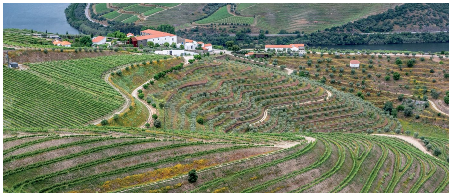
Historische Weinbaukultur für Portwein im berühmten Douro Tal in Portugal. Der Weinanbau hat aufgrund der günstigen klimatischen Bedingungen eine große Tradition, der Rebensaft ist Exportschlager.

Die portugiesische Wirtschaft basiert in erster Linie auf dem Dienstleistungssektor, der rund zwei Drittel des Bruttoinlandsprodukts (BIP) ausmacht. Innerhalb dieses Sektors ist der Tourismus ein besonders wichtiger Motor. Im vergangenen Jahr trug er fast 12 % zum BIP bei. Das ist zwar weniger als in Spanien, aber dennoch ein sehr hoher Wert. Vergangenes Jahr zählte das Land dem heimischen Statistikamt zufolge fast 30 Millionen ausländische Besucher. Angezogen werden sie nicht nur von den historischen Städten, sondern auch von der Küstenlandschaft und dem mediterranen Klima. Der Einbruch in Corona-Zeiten war auch in Portugal nur vorübergehender Natur. Die meisten Touristen kommen aus Großbritannien, Deutschland, Spanien und den USA. Letztere waren im ersten Halbjahr 2025 sogar die zweitstärkste Gruppe.